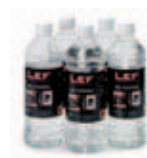
Lahve s bioethanolem