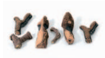
Imitace polen LOGSET KLASIK 6 ks