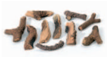
Imitace polen LOGSET KLASIK 10 ks