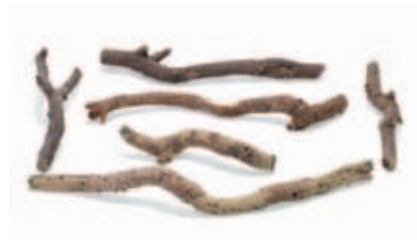
Imitace polen LOGSET SUPER 6 ks