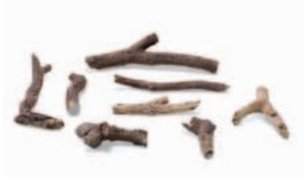
Imitace polen LOGSET SUPER 8 ks

Horící košík, unikátní, technicky perfektní. Lze jej použít různými způsoby. Lze vložit do stávajících ostení, již vybudovaných krbů, do moderních i klasických topenišť. Lze jej také použít jako samostatně stojící jednotku. Barva: stříbrná kovová metalická Rozměry: v. 172 x s. 445 x h. 235 mm