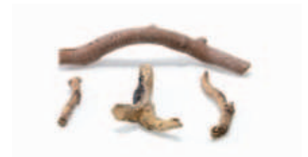
Imitace polen LOGSET SUPER 4 ks